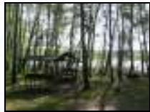
...direkt am Wasser