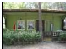
Mietbungalow für vier bis sechs Personen