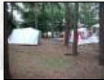
Zelten im Wald