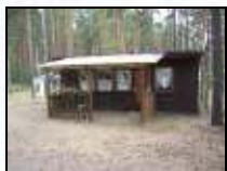
Mietbungalow für vier Personen