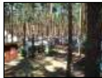
Camping im Grünen!