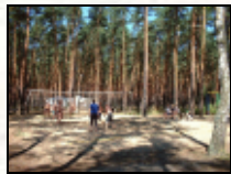
...und der Volleyballplatz für die Großen