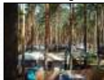
Camping in der Natur ist Erholung pur! ®