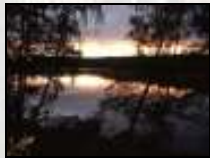
Die Schmöde am Morgen