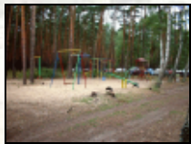
Spielplatz für die Kleinen...